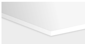
sandwich 20 mm

Per realizzare il file corretto è importante creare la grafica utilizzando il template scaricabile dal sito, oppure dal link nella mail di conferma d'ordine e consultare le istruzioni di preparazione file dedicate.