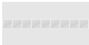
polionda 3,5 mm