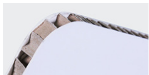
Nidoboard 16 mm bianco