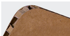
Nidoboard 16 mm avana

Per realizzare il file corretto è importante creare la grafica utilizzando il template scaricabile dal sito, oppure dal link nella mail di conferma d'ordine e consultare le istruzioni di preparazione file dedicate.