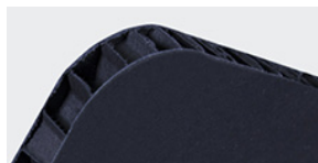
Nidoboard 16 mm nero